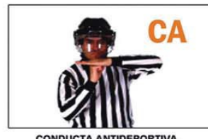
CA CONDUCTA ANTIDEPORATIVA