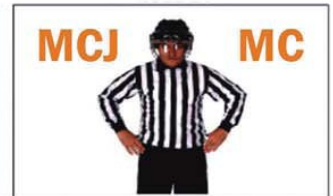
MCJ MALA CONDUCTA