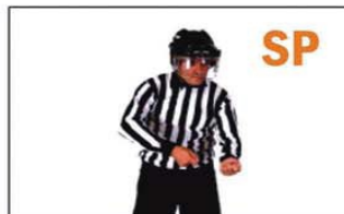
SP SPEARING (PUNZAR CON EL STICK)