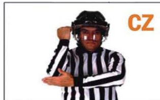
CZ ELBOWING (CODAZO)