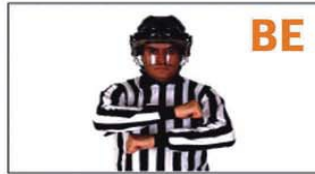
BE BUTT-ENDING (GOLPEAR CON EL EXTREMO DEL STICK)