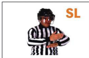
SL SLASHING (ATAQUE CON EL STICK)