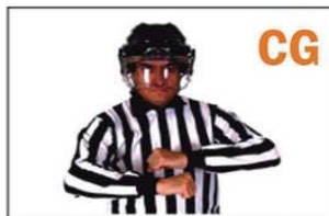
CG CHARGING (CARGA)