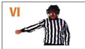
VI VIOLENCIA INNECESARIA-PELEA