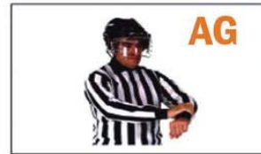
AG HOLDING (AGARRAR)