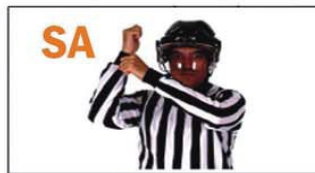
SA STICK ALTO