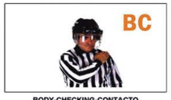
BC BODY-CHECKING-CONTACTO INTENCIONADO CON EL CUERPO