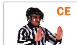
CE CARGA POR LA ESPALDA