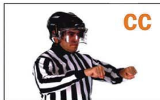
CC CROSS-CHECKING (ATAQUE CRUZADO CON EL STICK)