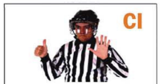
CI DEMASIADOS JUGADORES EN PISTA- CAMBIO ILEGAL