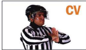
CV BOARDING (CARGA CONTRA LA VALLA)