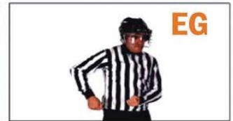
EG HOOKING (ENGANCHAR)