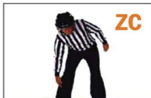
ZC TRIPPING (ZANCADILLA)